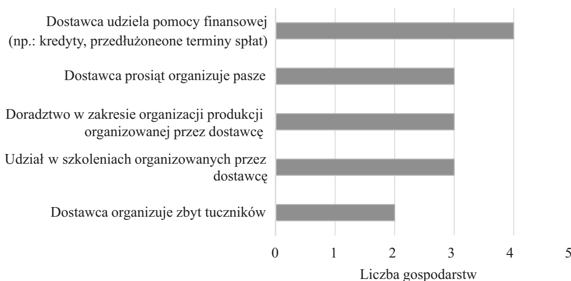
Rysunek 3. Zakres współpracy badanych gospodarstw z dostawcami

darstwo rolne zlokalizowane w Karnicach od 2014 roku współpracuje w tym zakresie z firmą Agro-TransHandel Sp. z o.o.. Benefitem tych powiązań jest możliwość zakupu materiału hodowlanego na podstawie faktury o przedłużonym terminie płatności (rys. 3). Gospodarstwa położone w Natolinie oraz w Lakowie od 2013 roku współpracują z firmą Agri Plus Sp. z o.o. W 2018 roku to przedsiębiorstwo wprowadziło możliwość zakupu warchlaków na kredyt u współpracującego banku. Takie rozwiązanie sprawia, producenci żywca wieprzowego mają możliwość odroczenia terminu zapłaty za materiał hodowlany, a zakłady mięsne utrzymują ciągłość produkcji. Inne korzyści współpracy z dostawcami warchlaków w badanych gospodarstwach przedstawiono na rysunku 3. We wszystkich badanych gospodarstwach dostawca udzielał pomocy finansowej rolnikom. Ponadto, dla trzech mniejszych gospodarstw organizował i dostarczał pasze lub dodatki paszowe. Właściciele współpracujących z przedsiębiorstwem gospodarstw mogli również brać udział w szkoleniach organizowanych przez dostawcę oraz korzystać z doradztwa w za-