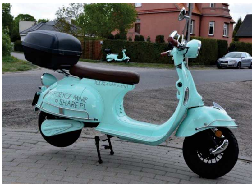
Rysunek 3. Elektryczny skuter w ramach usług „na minuty” w Poznaniu Figure 3 Electric scooter as a part of „per minute” services in Poznań