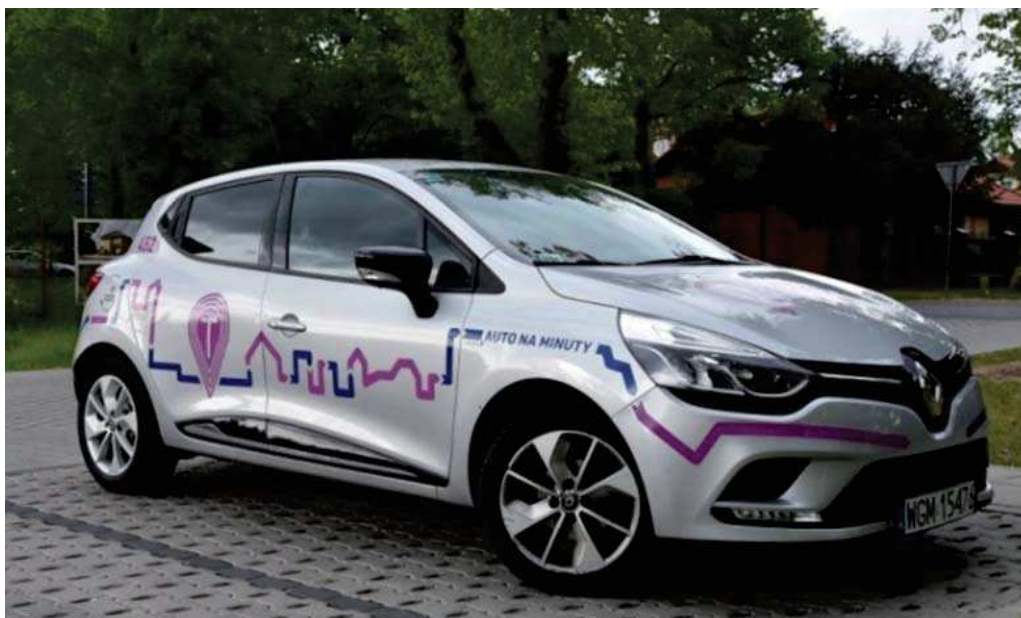
Rysunek 2. Samochód car sharingu w Poznaniu