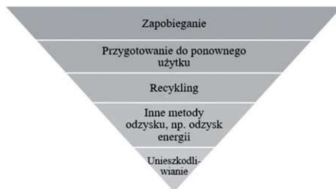
Rysunek 2. Hierarchia postępowania z odpadami

Powyższa systematyka pokazuje priorytetyzację działań w przepisach prawa i polityce, które odnoszą się do uniemożliwienia powstania odpadów oraz do ogólnego gospodarowania odpadami, aby osiągnąć maksymalny dla środowiska wynik całkowity. Odstępstwo od takiej hierarchii może dotyczyć wybranych strumieni i jest możliwe wtedy, gdy jest uzasadnione, np. problemem z wykonalnością techniczną, nieopłacalnością ekonomiczną i nieprawidłową ochroną środowiska [Dyrektywa Parlamentu Europejskiego..., 2008].