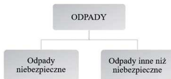
Rysunek 1. Podstawowa klasyfikacja odpadów

Ustawa o odpadach określa odpad jako „każdą substancję lub przedmiot, których posiadacz pozbywa się, zamierza się pozbyć lub do których pozbycia się jest zobowiązany” [Ustawa o odpadach..., 2012]. W dyrektywie o odpadach zawarta jest podstawowa klasyfikacja odpadów, najogólniej można je podzielić na dwie grupy (rys. 1).