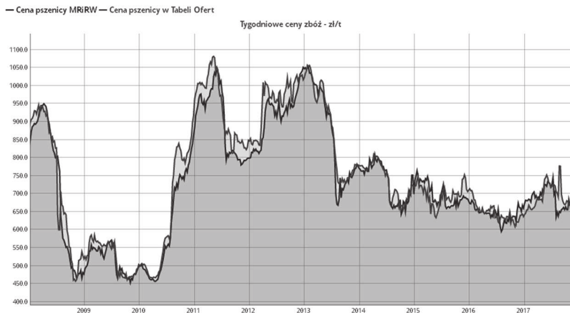
Rysunek 2. Zmienność notowań tygodniowych cen pszenicy na polskim rynku w latach 2008–2017

Figure 2. Volatility of weekly prices of wheat on the Polish market in 2008–2017